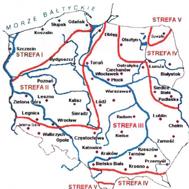
Rys. 1 Strefy klimatyczne Polski i temperatury obliczeniowe

Położenie obiektu, w którym planowany jest montaż, na mapie ma wpływ na pracę instalacji oraz na dobór mocy projektowanego kotła. W zależności od współrzędnych geograficznych rozbieżności w temperaturach projektowych mogą mieć znaczącą wartość i wpływ na zapotrzebowane na ciepło w budynku. W skali kraju ilustruje to poniższa mapa (Rys.1).